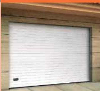
INNO 100 R (vaakaura)

Vaakauritetun nosto-oven lamelleissa suunnittelu perustuu 10 cm leveisiin nauhoihin, jotka muodostavat jatkuvan kuvion peittäen lamellien liitokset.