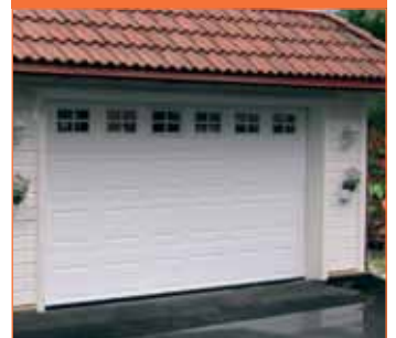
INNO 100 C (peilikuvioinen)

Peilikuvioisen nosto-oven paneelit ovat koho-pintaiset, nelikulmaisia kasetteja on saman verran jokapaneelilla. Tämä ovimalli sopii hyvin perinteisen tyylin taloihin. (Ikkunat eivät sisälly vakioimitukseen)