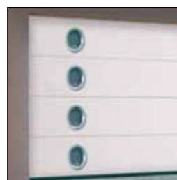
Ikkunavaihtoehdot (saatavana kymmeniä erilaisia ikkunamalleja)