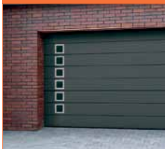
INNO 100 M (leveä vaakaura)

Suoruutta suunnitteluun. Ajaton malli, joka käy taloon kuin taloon ja antaa oveen jyvän ilmeen.