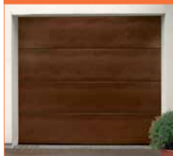
INNO 100 F (sileä)

Sileäpintaisista lamelleista muodostuvassa ovelsa on täysin moderni, minimalistinen arkkitehtuuri. Sopii erityisen hyvin pelkistettyjen talojen autotallinoveksi.